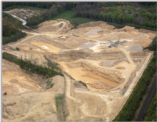
BLOCS BRUTS / ENROCHEMENTS