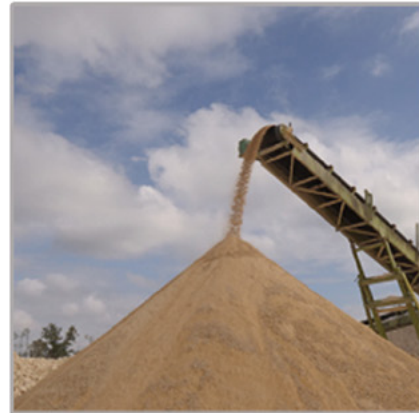
GRANULATS / SABLE À TENNIS / REMBLAIS

Impasse des Cerisiers 60740 SAINT-MAXIMIN