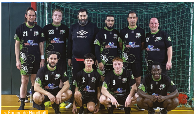
> Équipe de Handball

Le chiffre à retenir : 4000, c'est le nombre d'abonnés à la page Facebook ! > Ville Saint-Maximin Oise