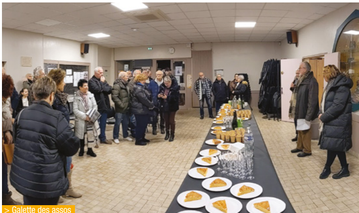
> Galette des assos