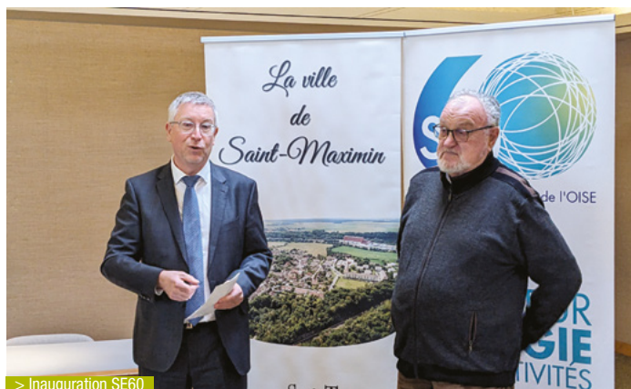
> Inauguration SE60